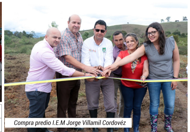
Compra predio I.E.M Jorge Villamil Cordovéz

Beneficiarios: Estudiantes de las I.E.M. José Eustasio Rivera de Bruselas, Jorge Villamil Cordovéz y Guacacallo.