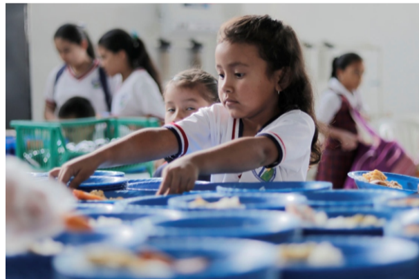
Beneficiarios: población estudiantil programa PAE.