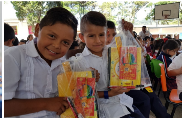
Beneficiarios: 40.400 niños y niñas con kit escolares.

Como mérito de la institucionalidad local, la calidad educativa en Pitalito obtuvo una calificación de 280 puntos ubicándose entre las mejores del País. Finalmente, nuestra secretaria de educación ocupa el primer lugar en el proceso de respuesta de calidad y eficiencia en atención al ciudadano