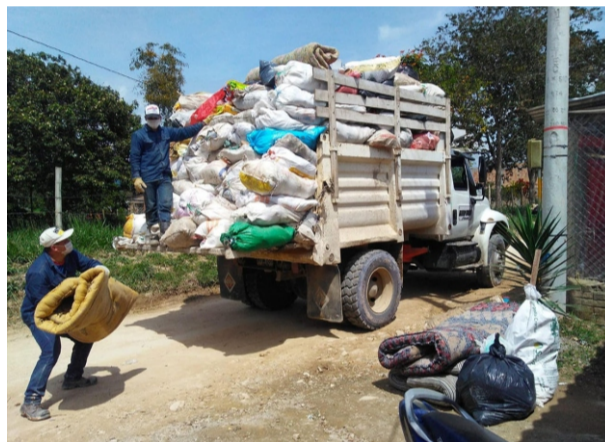
Beneficiarios: 6.240 familias de 85 veredas del municipio.

Corregimientos: Charguayaco, La Laguna, Regueros, Guacacallo, Palmarito, Chillurco y Criollo.