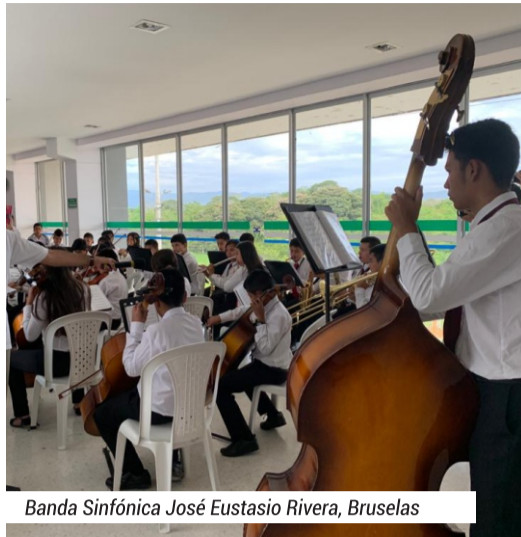
Banda Sinfónica José Eustasio Rivera, Bruselas

La educación es fundamental para la transformación de la sociedad a partir de la construcción de un nuevo liderazgo que empodere a los estudiantes, docentes y directivos contribuyendo al desarrollo y la formación humana en el fortalecimiento del conocimiento, por ello, propusimos la implementación de estrategias, planes, programas y proyectos en la búsqueda de esos objetivos.