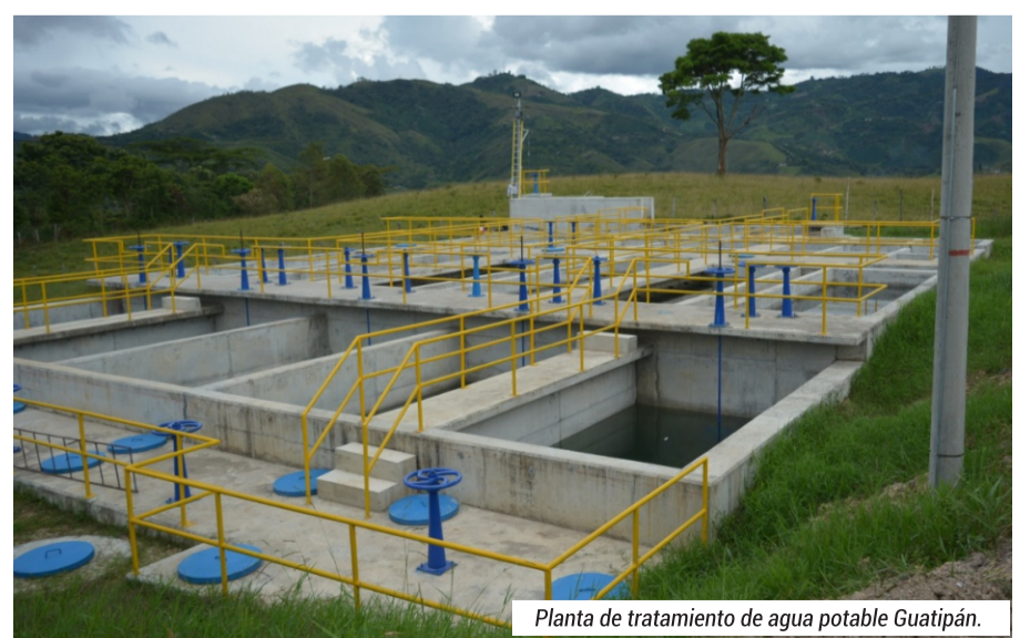
Planta de tratamiento de agua potable Guatipán.

Las obras ejecutadas, en ejecución y contratadas correspondientes al plan maestro de acueducto en las fases II y III fases; y la fase 1 del plan maestro de alcantarillado de Pitalito suman un total de $ 34 mil 468 millones de pesos, que garantizan la calidad, cobertura y continuidad en la prestación de estos servicios vitales para la salud de las personas.