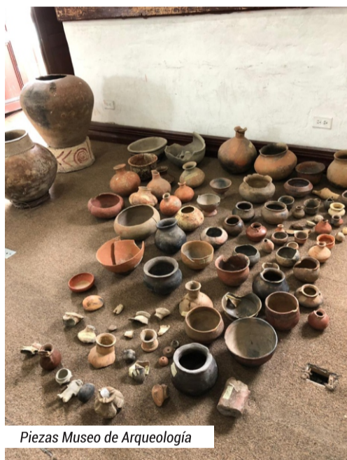
Piezas Museo de Arqueología