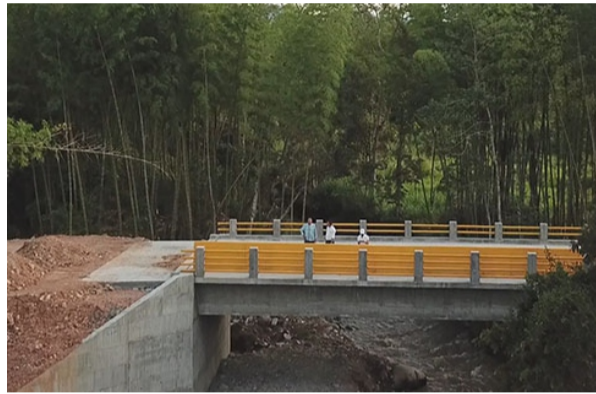
* Puente Campo Bello, corregimiento de Bruselas