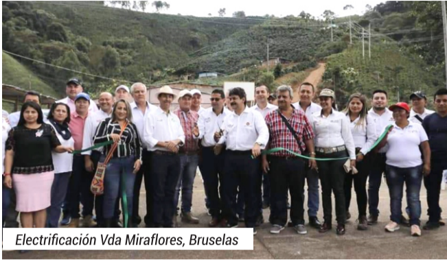
Electrificación Vda Miraflores, Bruselas