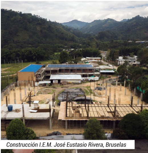
Construcción I.E.M. José Eustasio Rivera, Bruselas

INVERSIÓN TOTAL $ 47.000 MIL MILLONES DE PESOS