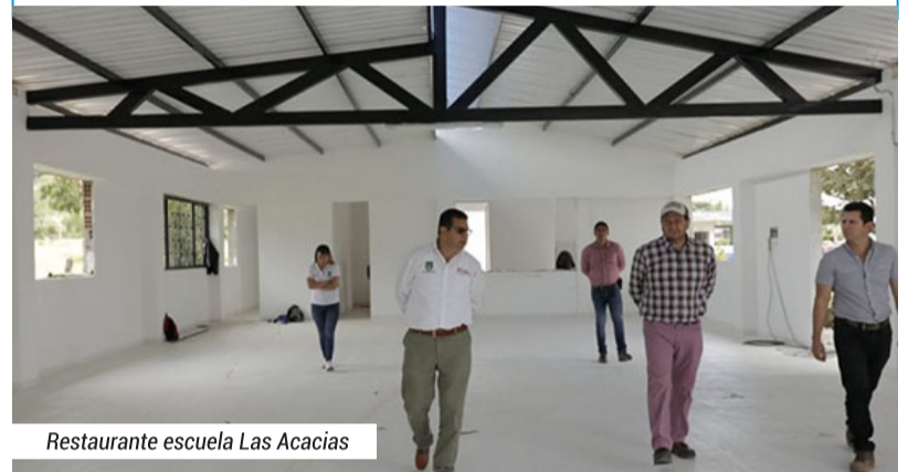
Restaurante escuela Las Acacias