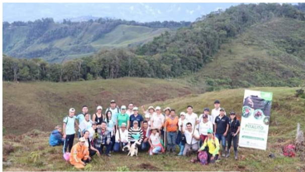
Vereda Alto Santa Rita y Resinas, 55.4 hectáreas

Se adquirieron 230 hectáreas de zonas de reserva ambiental, localizadas en ecosistemas estratégicos del Municipio de Pitalito.