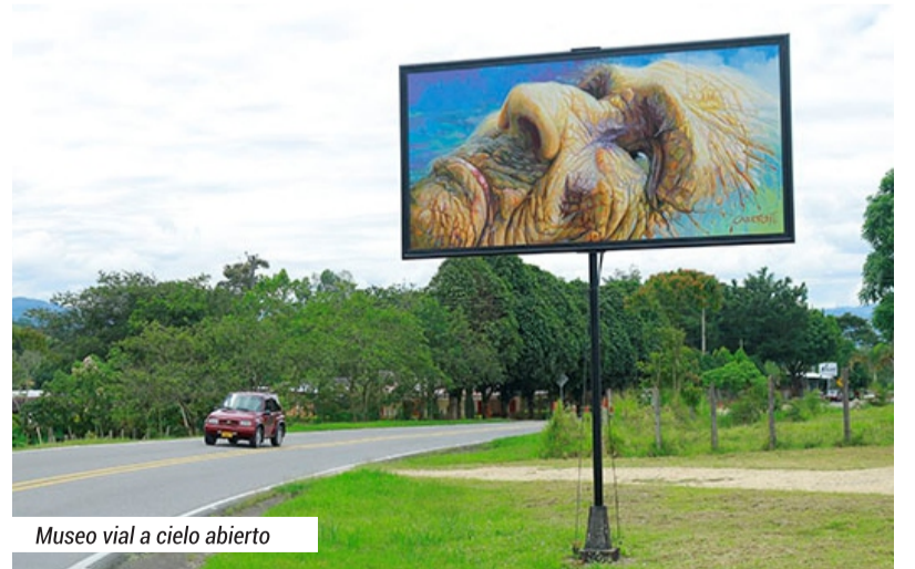
Museo vial a cielo abierto