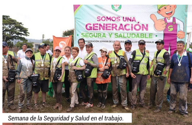
Semana de la Seguridad y Salud en el trabajo.

✓ Se disminuyó el número de población pobre NO asegurada al sistema general de salud. En el año 2016 recibimos 1005 ciudadanos en esta estadística y en 2019 entregamos solo 17 personas NO cubiertas.