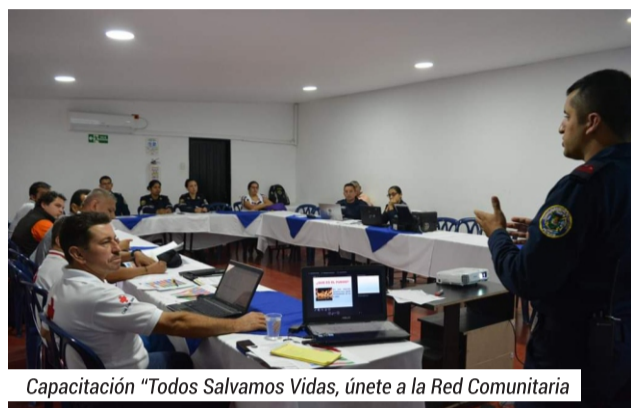
Capacitación "Todos Salvamos Vidas, únete a la Red Comunitaria"