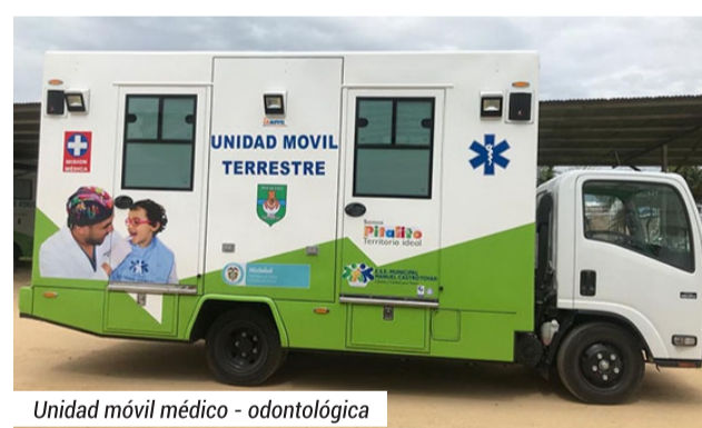
Unidad móvil médico - odontológica