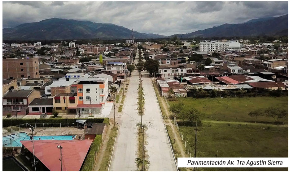
Pavimentación Av. Tra Agustín Sierra

INVERSIÓN $306.197.060 MILLONES DE PESOS