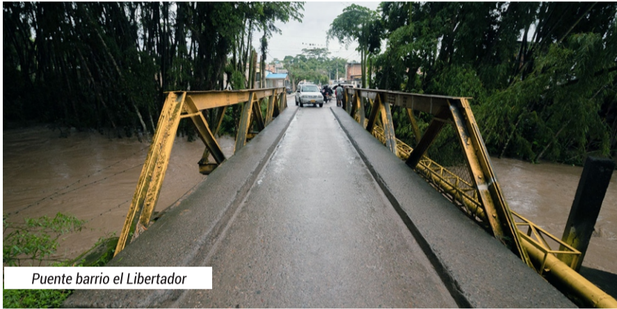
Puente barrio el Libertador