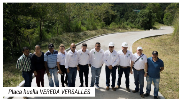
Placa huella VEREDA VERSALLES