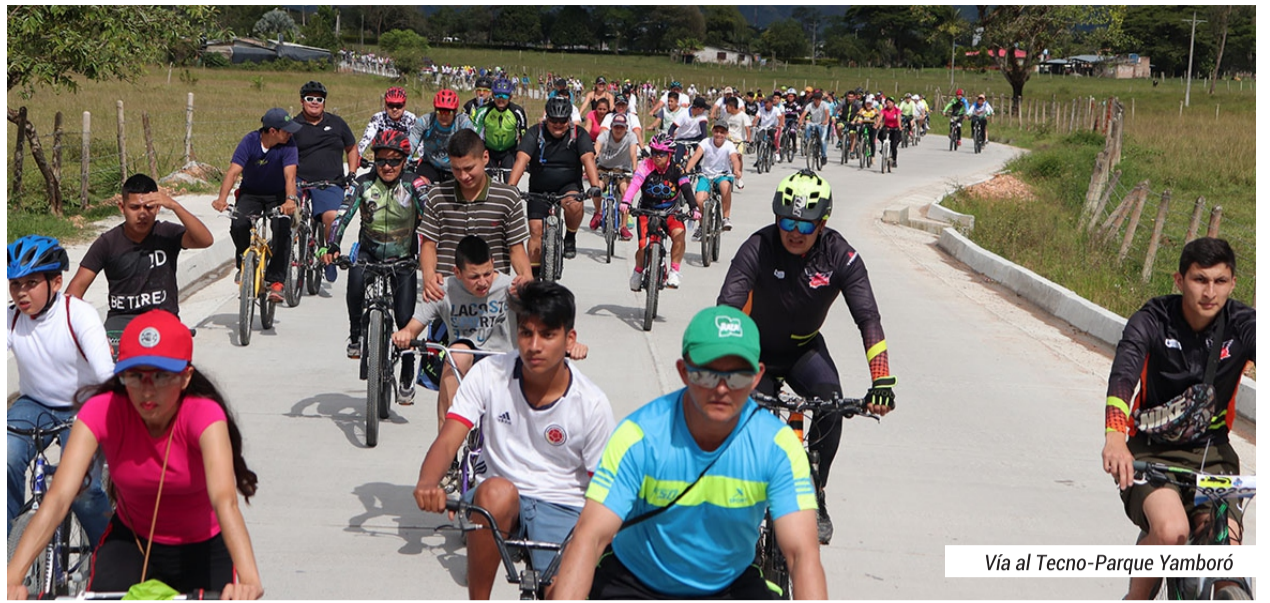
Vía al Tecno-Parque Yamboró