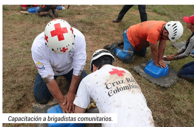
Capacitación a brigadistas comunitarios.