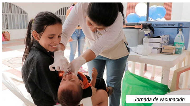
Jornada de vacunación

La secretaría de salud municipal obtuvo las más altas calificaciones en capacidad de gestión y desempeño durante las vigencias 2017 y 2018, ubicándola como la mejor del Huila.