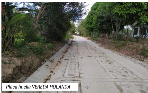
Placa huella VEREDA HOLANDA

Con aproximadamente 20 kilómetros hemos generado un impacto positivo en 80 veredas de los 8 corregimientos de Pitalito, donde se adelantan trabajos de placa huella ofreciendo mejores condiciones de acceso y transporte de la producción agrícola desde el campo hasta los centros de acopio.