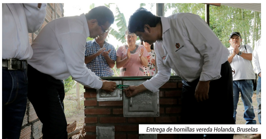
Entrega de hornillas vereda Holanda, Bruselas

En los últimos cuatro años, en convenio con otras entidades se ejecutaron 2.148 mejoramientos de vivienda en los sectores urbano y rural del municipio que incluyó a la población más carente de apoyo gubernamental. Baterías sanitarias, cocinas, pisos, cubiertas, sistemas sépticos, hornillas ecológicas, entre algunas otras obras, hicieron parte de este proceso.